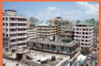
Dar es Salaam